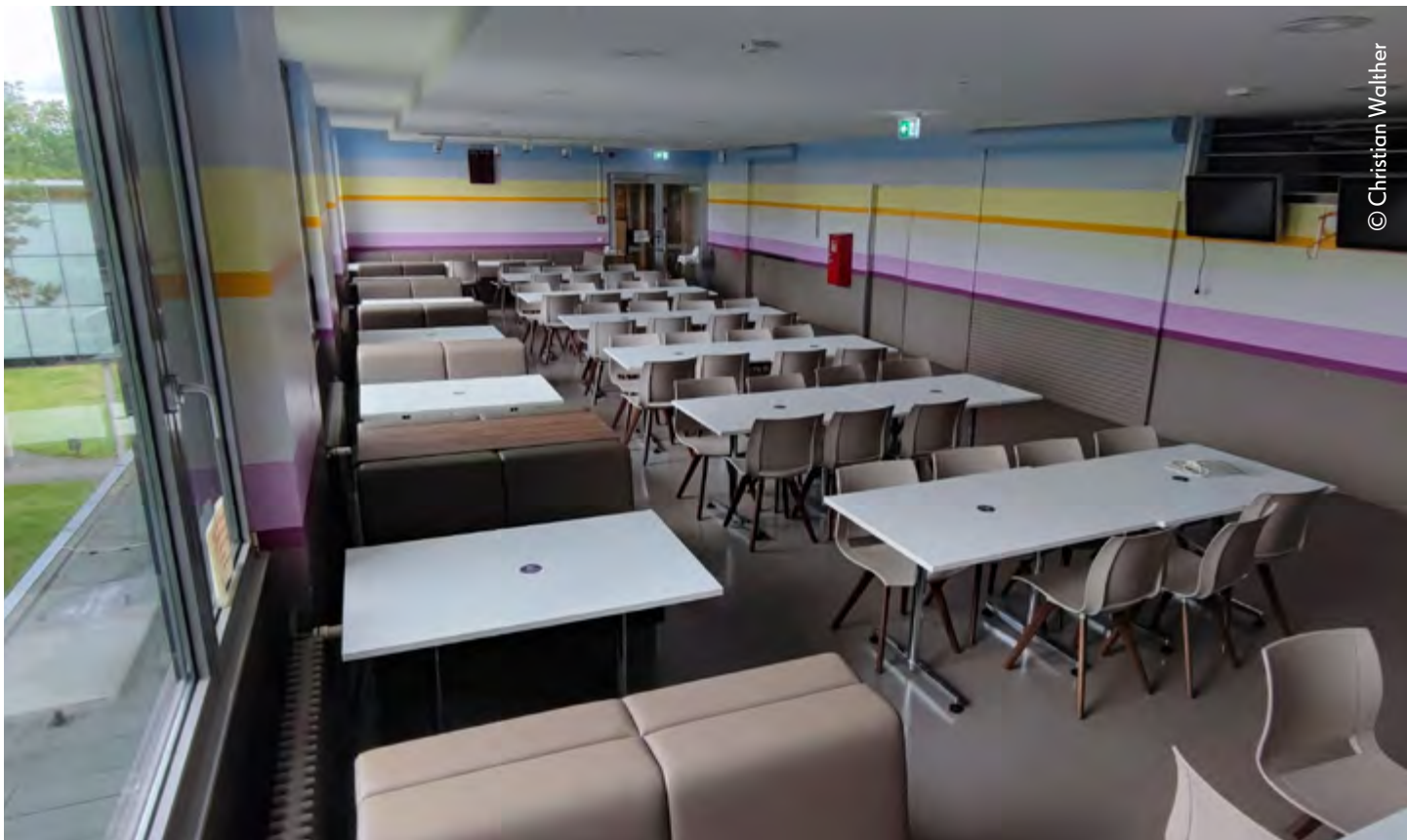
Ein normaler Tag im Semester: ob morgens, ob mittags - der Backshop steht offen, der Backshop steht leer.

Die Diagnose ist in Zeiten von Inflation aktueller denn je. 2021 errechnete das Statistische Bundesamt, dass knapp 40 Prozent der Studierenden armutsgefährdet seien. Die Schließung der Backshops bedeutet für eben diese Studierende, in ihrer Pause keinen Zugang zu einer günstigen vollwertigen Mahlzeit zu haben.