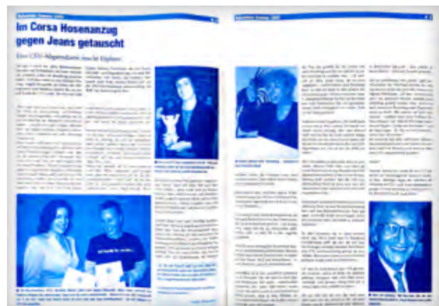
OSI-Absolventin Dorothee Bär (damals noch Dorothee Mantel) 2005 mit ihrer Festrede im Newsletter des OSI-Clubs.

Allerdings: Als Bär im Jahr 2005 ihr Politologie Studium am OSI mit einem Diplom abschloss, saß sie schon 3 Jahre lang als Abgeordnete im Deutschen Bundestag. »Ich bin immer zwischen Reichstag und OSI hin und her gependelt«, erzählte sie damals bei ihrer Diplomfeier. »Ich dachte, es erkennt mich keiner und habe im Auto immer schnell den Hosenanzug gegen die Jeans getauscht.« Aber letztendlich sei man doch ein politischer Mensch und habe sich doch offensiv eingemischt, gestand sie.