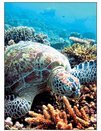
En grønn skilpadde tar seg en hvil på koraller utenfor den malaysiske øya Sipadan.

myrdet der. Et av barna ble igjen i England, et havnet i Ecuador, og da slektingene bestilte minnesteiner og klarte å samle familien, hadde ikke søsknene sett hverandre på 60 år. Nå har de familiesamling hvert år på årsdagen for steinnedleggelsen.