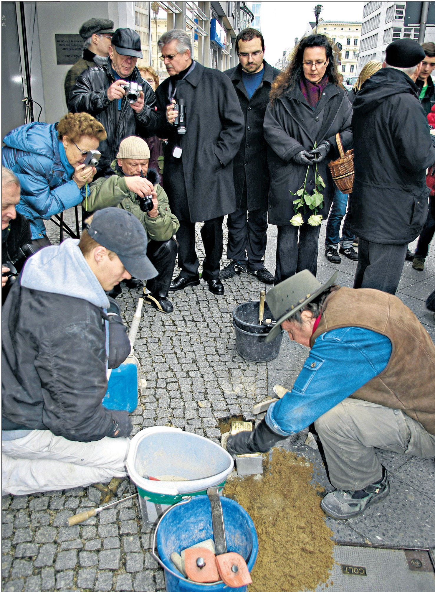
Kunstner Gunter Demnig har personlig lagt ned hver eneste av de nå over 19 000 steinene som danner et nettverk gjennom Europa. Minnesteinene med messingplater viser navn på noen av nazismens mange ofre. Denne dagen minnes tryllefamilien Kroner fra Berlin.

■ Kjøpes inn av familie eller lokalsamfunn