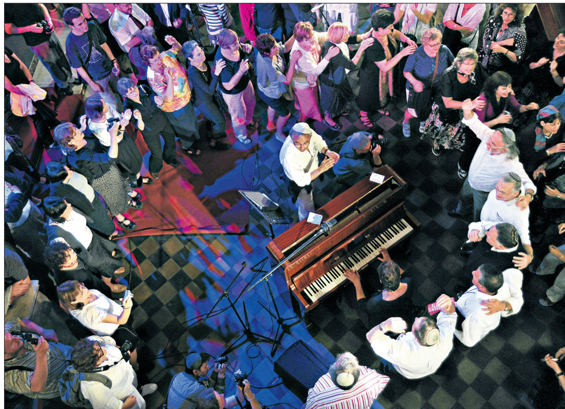
Jødisk dans og klezmermusikk. Under festivalen holdes kurs i gamle kunster.