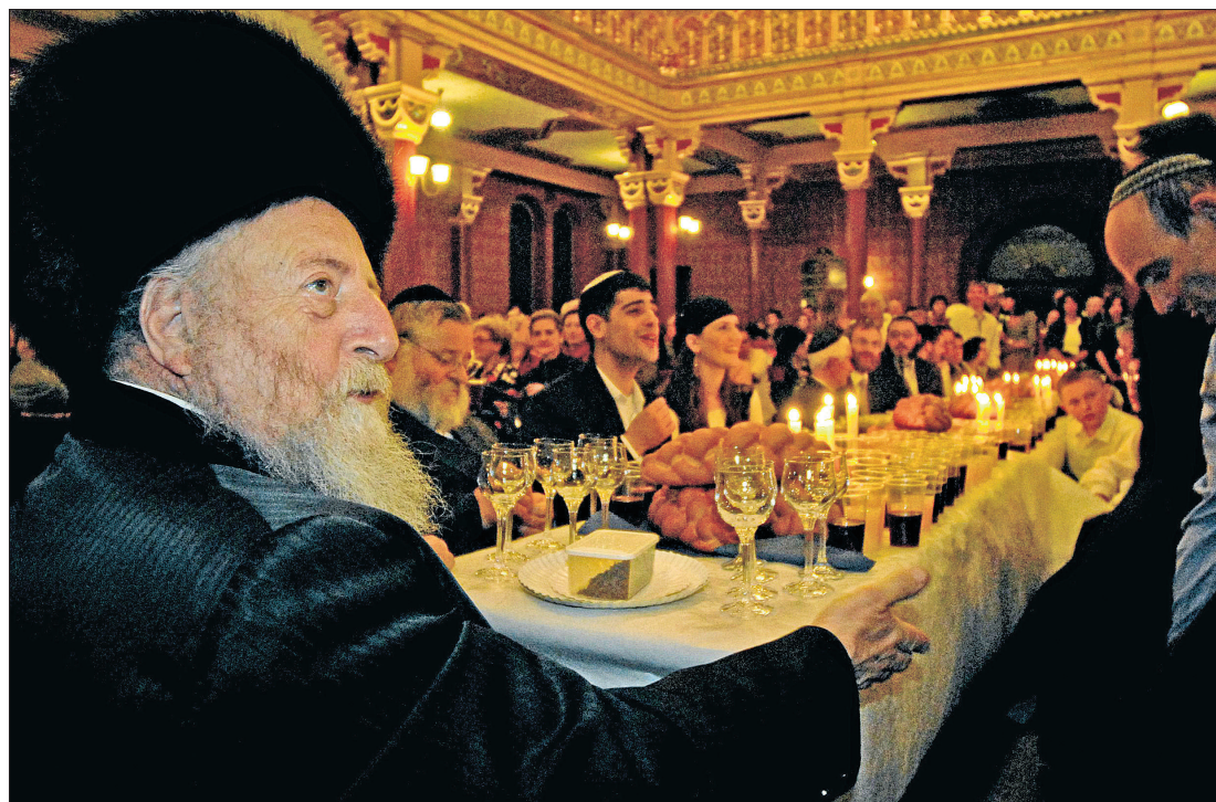
Tradisjonelle retter, fantastiske bordoppdekninger og karikerte typer i vakre omgivelser. Mange tiltrekkes av det eksotiske i en gammel kultur.

Sorgen etter Holocaust har tre faser. – Først gråter vi, så kommer stillheten. Den tredje, vanskeligste og vakreste, er sangen, sier lederen for den jødiske kulturfestivalen i Krakow.