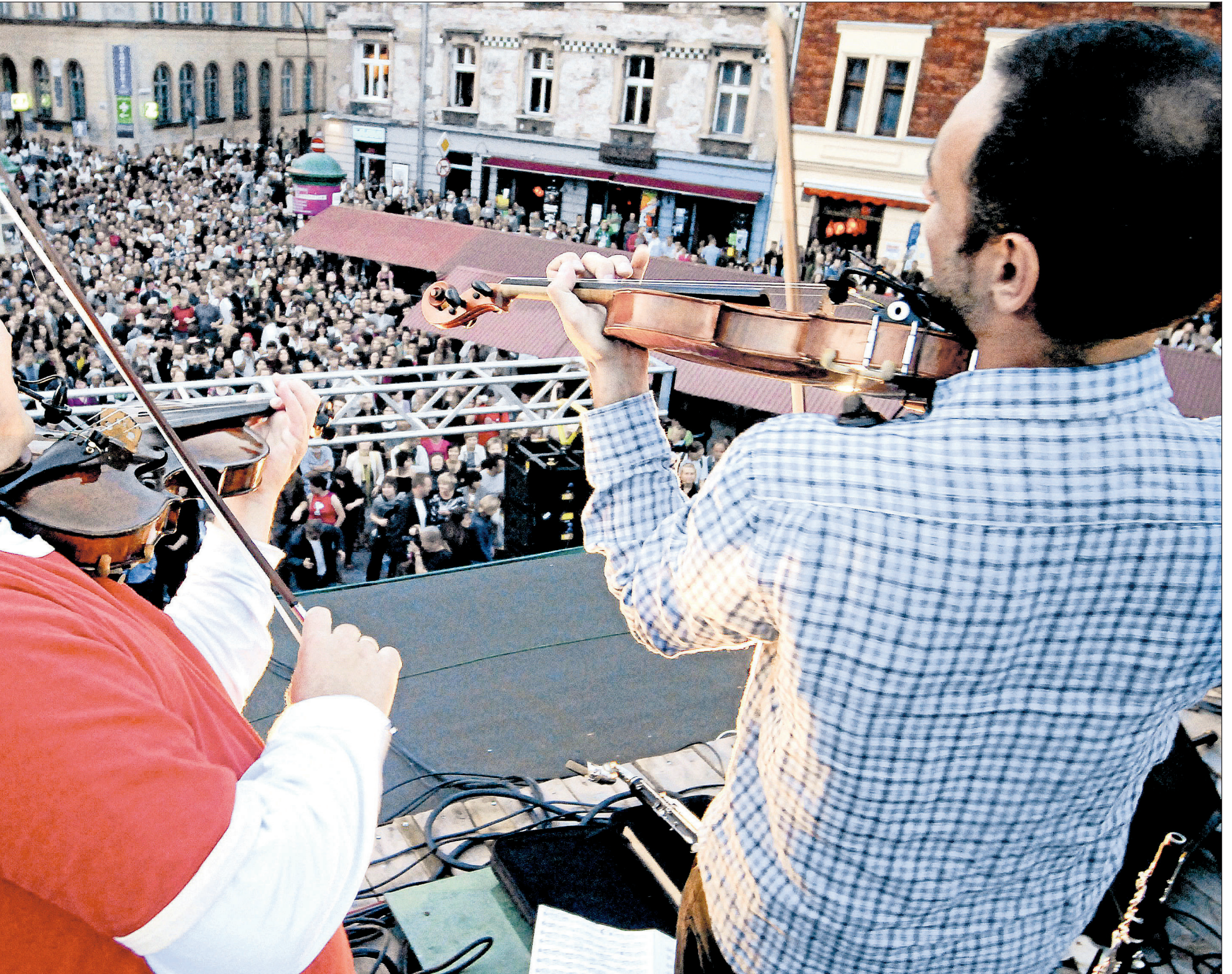
Utekonert i Krakow. Den polske byen syder av liv under den jødiske kulturfestivalen. Hit kommer stadig flere ikke-jøder, som vil lære om den jødiske kulturen.