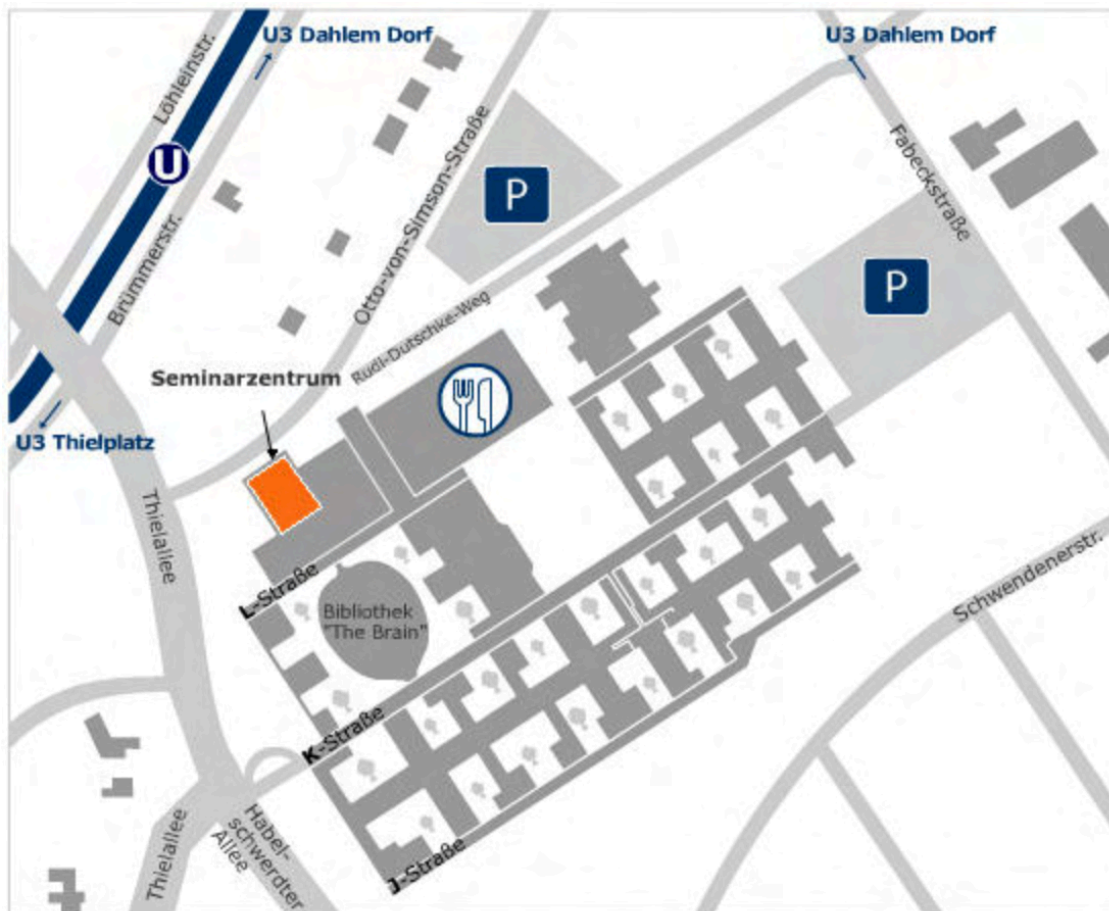
Lageplan des Seminarzentrums in der Silberlaube der Freien Universität

Tagungsort: Seminarzentrum FU Berlin (Silberlaube – Erdgeschoss), Otto-von-Simson-Straße 26, 14195 Berlin-Dahlem